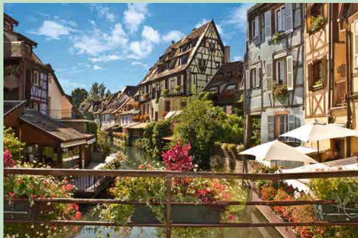
Document non contractuel

Relais Départemental des Gîtes de France du Haut-Rhin 1, rue Schlumberger – CS 40055 68025 COLMAR Cedex